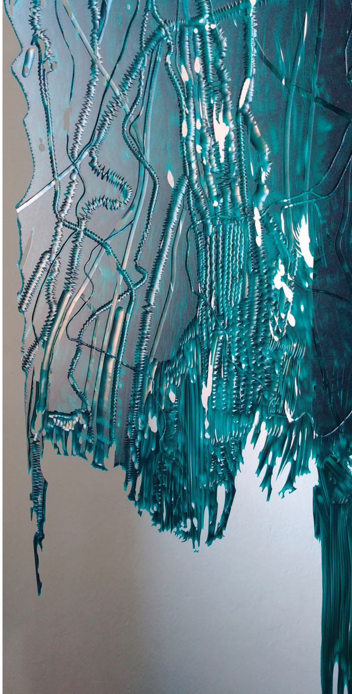
Variabilita, 2020, objekt, detail, PVC pásy a rytina Variability, 2020, object, detail, PVC strips and engraving