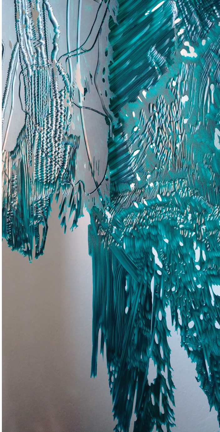
Variabilita, 2020, objekt, detail, PVC pásy a rytina Variability, 2020, object, detail, PVC strips and engraving