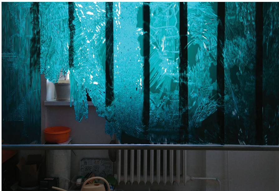
Variabilita, 2020, objekt, detail, PVC pásy a rytina Variability, 2020, object, detail, PVC strips and engraving

Od roku 2020 se kurátorský záměr Galerie Altán Klamovka vyvíjí mimo hlavní kurátorský důraz na post-konceptuální kresbu také na aktuální témata v umění, jakými jsou udržitelnost v umění a mezigenerační dialogy nastupující a střední generace.