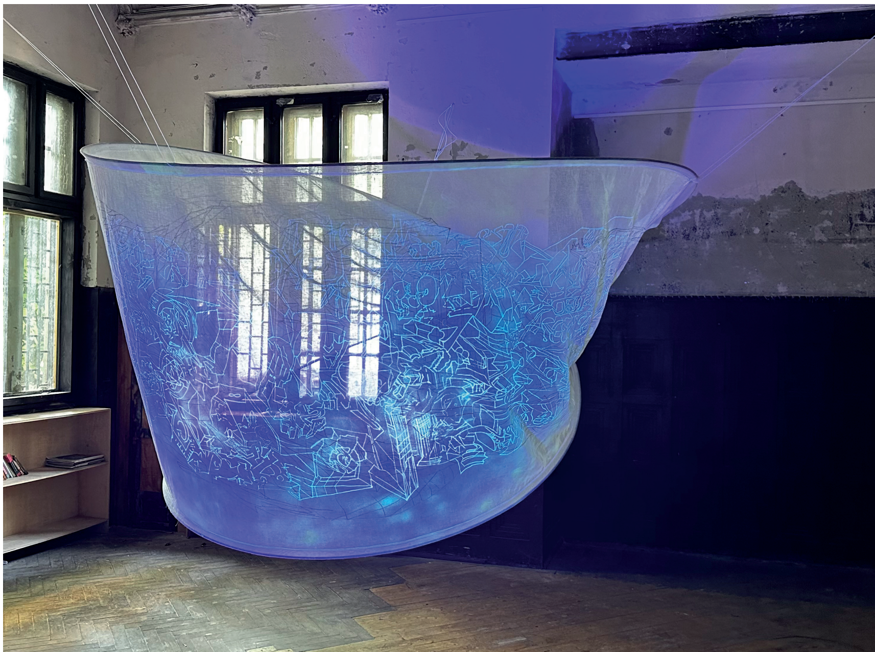
Palimpsest: Rewriting City, 2023, příprava na site-specific instalaci Palimpsest: Rewriting City, 2023, preparation for site-specific installation